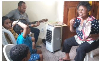
RODA DE CONVERSA - AULA DE INICIAÇÃO MUSICAL