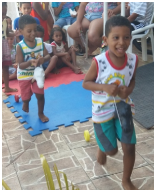
CORRIDA DE CAVALO DE PAU - TARDE DA ALEGRIA