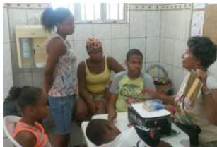
LIVRO SEM PALAVRAS - AGUARDANDO AULA DE INFORMÁTICA