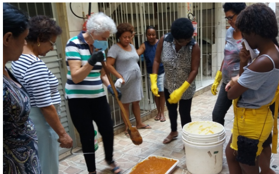
OFICINA DE SABÃO