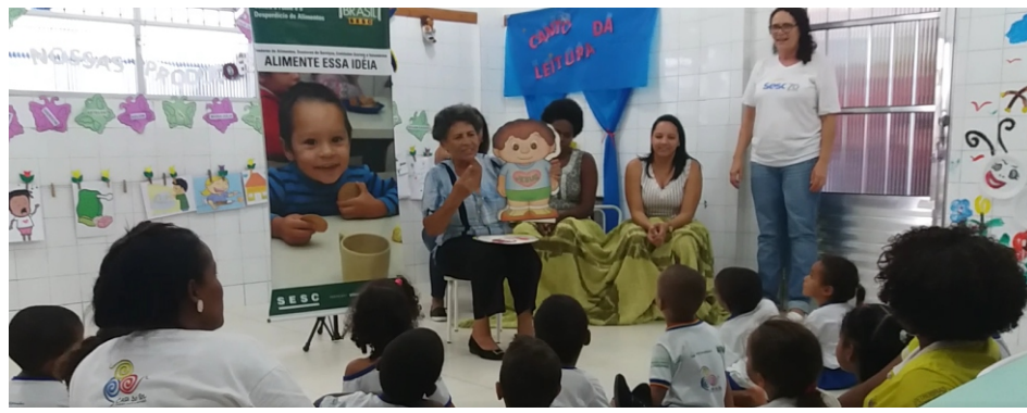
CONTAÇÃO DE HISTÓRIA NA ESCOLA CASA DO SOL - EM PARCERIA COM MESABRASIL

JÁ ESTÁ FUNCIONANDO A ESCOLA DE PAIS E O GRUPO MULTI FAMILIAR.