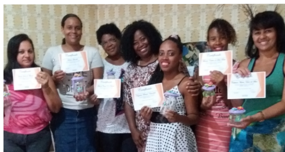
ENCERRAMENTO DA 1ª TURMA DE BISCUIT - RECEBENDO CERTIFICADO